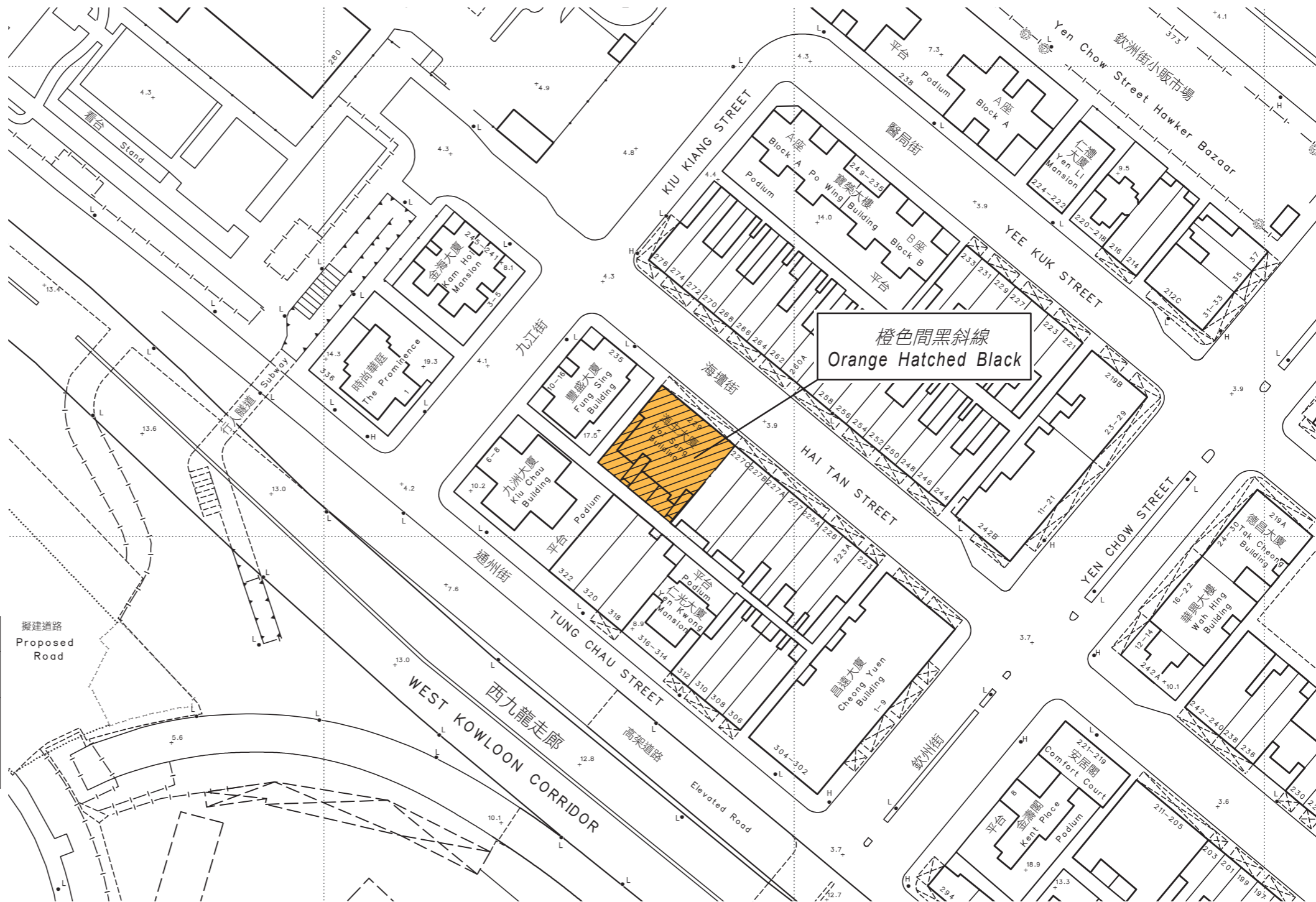
面積約 431.34 平方米的將予收回土地以橙色間黑斜線標示 COLOURED ORANGE HATCHED BLACK AREA 431.34 SQUARE METRES (ABOUT) TO BE RESUMED