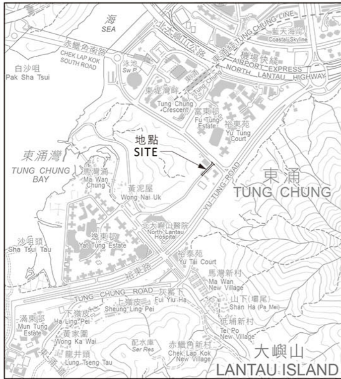
比例 SCALE 1:20 000