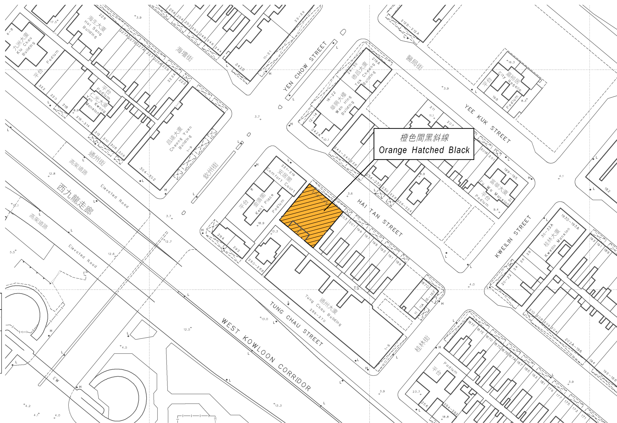
面積約 422.71 平方米的將予收回土地以橙色間黑斜線標示 COLOURED ORANGE HATCHED BLACK AREA 422.71 SQUARE METRES (ABOUT) TO BE RESUMED