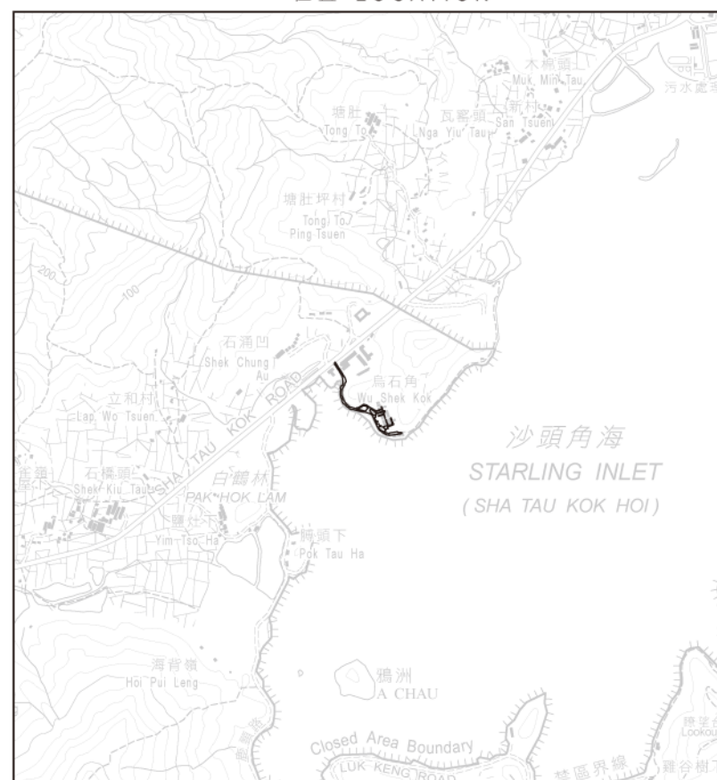
比例 SCALE 1:20000